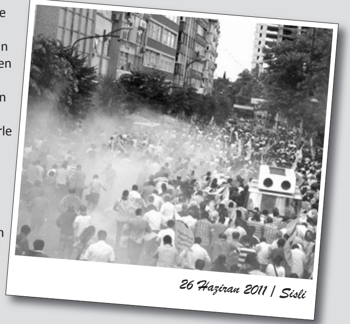
26 Haziran 2011 | Şişli

Zincir'in ardından Emek, Demokrasi ve Özgürlük Bloku İstanbul Milletvekili Levent Tüzel söz aldı. Emniyet müdürünün polis müdahalesine arka çıkan açıklamalarından kaygı duyduklarını belirtti.