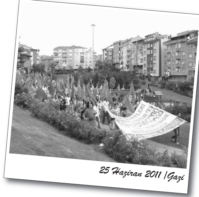
25 Haziran 2011 | Gazi