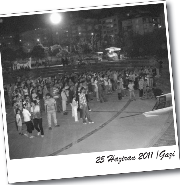
25 Haziran 2011 | Gazi